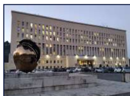
MINISTERO DEGLI AFFARI ESTERNI