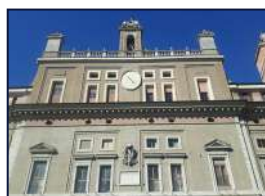
MINISTERO DELLA CULTURA