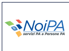
MINISTERO DELL'ECONOMIA E DELLE FINANZE