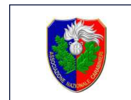
ASSOCIAZIONE NAZIONALE CARABINIERI