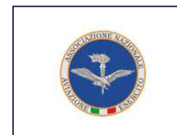
ANAE - ASSOCIAZIONE NAZIONALE AVIAZIONE ESERCITO