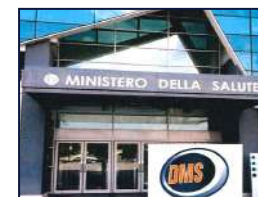
DOPOLAVORO DEL MINISTERO DELLA SALUTE