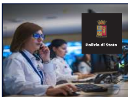
FONDO ASSISTENZA PERSONALE POLIZIA DI STATO