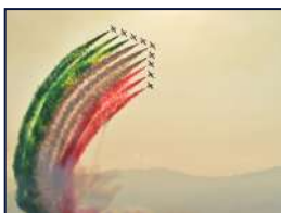
STATO MAGGIORE DELLA DIFESA