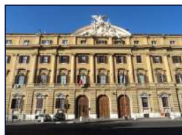
MINISTERO DEL TESORO

Mutua Nazionale stipula costantemente convenzioni con enti e realtà su tutto il territorio nazionale.